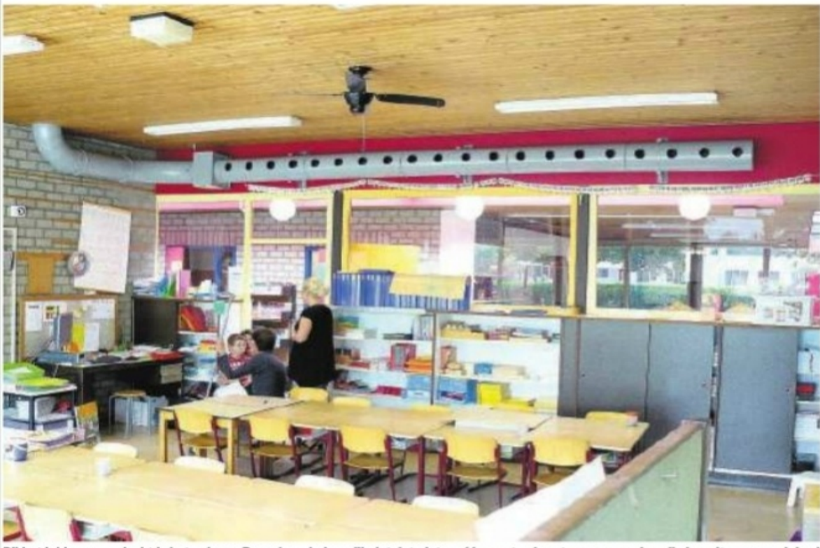
Bij het inblazen van lucht is het volgens Rasenberg belangrijk dat dat niet op één punt gebeurt, maar over de volle breedte van een lokaal. Met een buis vol gaten is dat te bereiken.

„De meeste installatieadviesbureaus lopen dertig jaar achter. Er wordt sinds de jaren 80 geen onderzoek meer gedaan naar het binnenklimaat op scholen. Als een systeem maar aan het bouwbesluit voldoet, is het goed. Of het in de praktijk echt werkt, wordt nauwelijks onderzocht. Eigenlijk zou